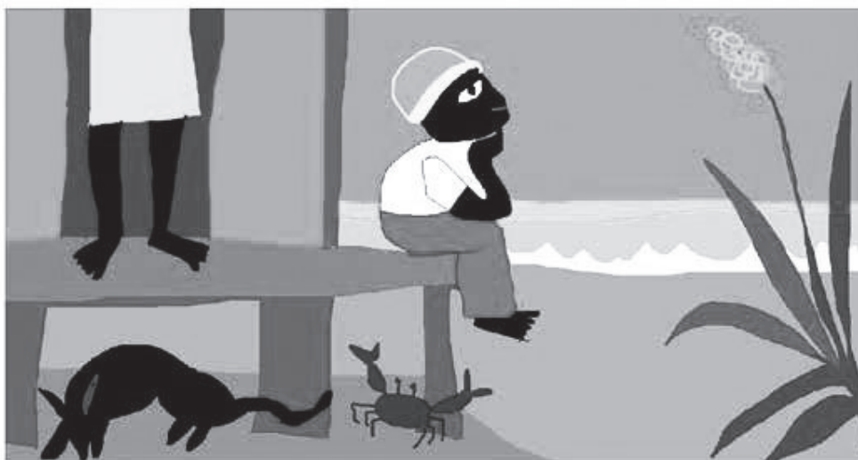
“Cahuita”, ilustración digital de JOHNNY VILLARES B.

Profesor universitario, abogado penalista